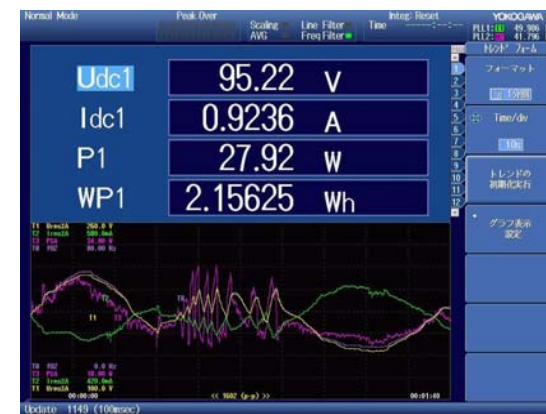
電力データとトレンド表示