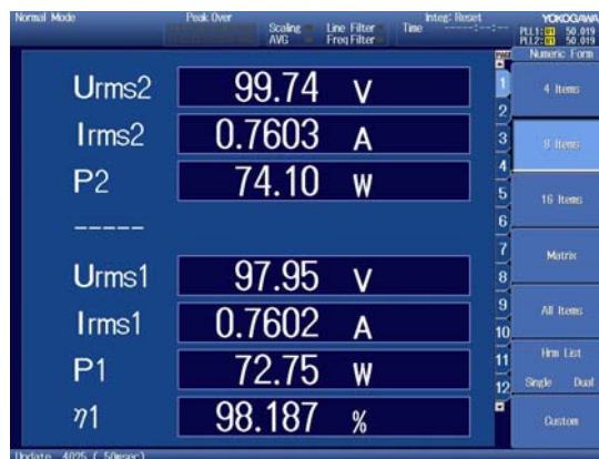
入出力電力と効率測定

WT1800 プレジジョンパワーアナライザ 最大6電力入力で50Aまで直接入力できます。 大電流では電流センサーをご用意しています。