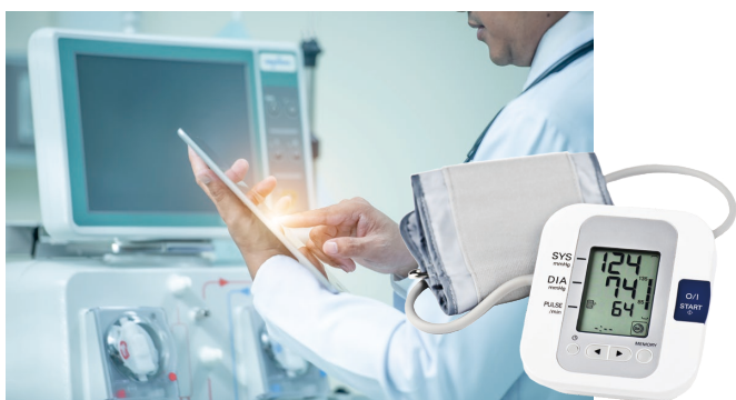
血圧計、ウェアラブル端末、ベッドサイドモニターなど

市場：医療機器・血圧計 デジタル圧力計 MT300 / 圧力コントローラ MC300