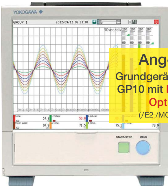
Bildschirmdatenschreiber GP20 20 Kanäle (erweiterbar auf 100 Kanäle)

Erfassung, Darstellung und Aufzeichnung von unterschiedlichsten Parametern