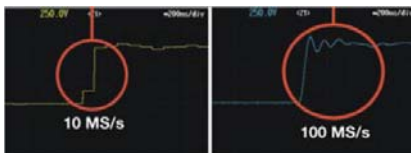
Signalauflösung von zwei unterschiedlichen Abtastraten

Der besonders große Speicher ermöglicht eine hohe Abtastrate (bis zu 100 MS/s pro Kanal). Bei größerem Speicher kann einerseits eine höhere Abtastrate für mehr Signaldetails oder andererseits eine höhere Zeitbasiseinstellung für eine längere Erfassungszeit bereitgestellt werden.