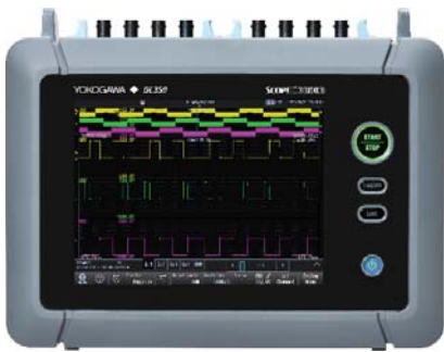
ScopeCorder - DL350

Der DL350 ScopeCorder kombiniert in einem kompakten Gerät alle Mess- und Aufzeichnungsmöglichkeiten die Sie benötigen, egal ob im Feld, Labor oder am Prüfstand.