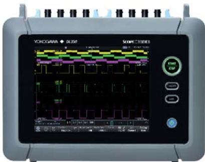
ScopeCorder - DL350

Der DL350 ScopeCorder kombiniert in einem kompakten Gerät alle Mess- und Aufzeichnungsmöglichkeiten die Sie benötigen, egal ob im Feld, Labor oder am Prüfstand.