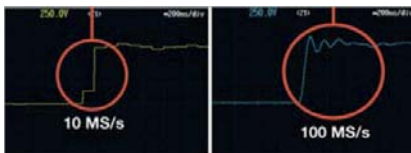
Signalauflösung von zwei unterschiedlichen Abtastraten

Der besonders große Speicher ermöglicht eine hohe Abtastrate (bis zu 100 MS/s pro Kanal). Bei größerem Speicher kann einerseits eine höhere Abtastrate für mehr Signaldetails oder andererseits eine höhere Zeitbasiseinstellung für eine längere Erfassungszeit bereitgestellt werden.